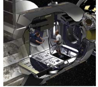
מערכות חלל: לוקהיד מרטין תבנה עבור נאס"א אבטיפוס של יחידת מגורים בחלל.