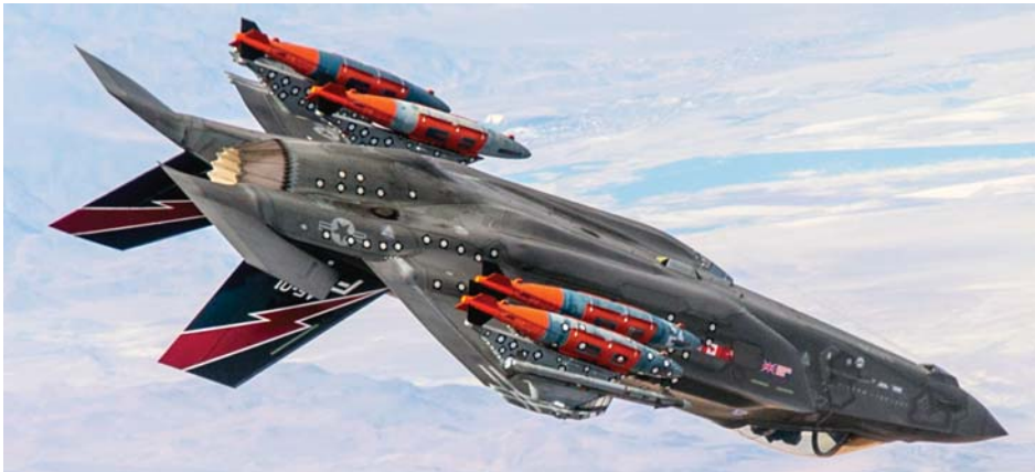
למעלה: F-35A נושא ארבע פצצות JDAM. למטה: F-35B משגר טיל אוויר-אוויר ASRAAM.