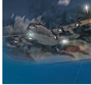
מטוסי תובלה: C-130J-SOF: סופר הרקולס מותאם לתמיכה בכוחות למבצעים מיוחדים.