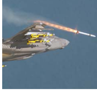
מטוסי קרב מהדור החמישי: הושג ציון הדרך של 100,000 שעות טיסה במטוסי ה-F-35.